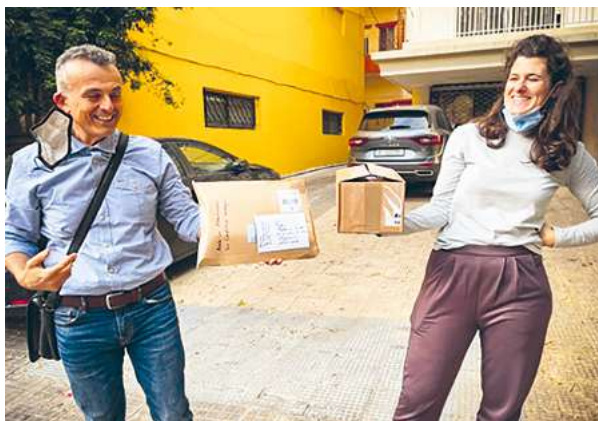
Die Pakete mit den Hörhilfen werden dem Schulleiter der LCD im Libanon überbracht.