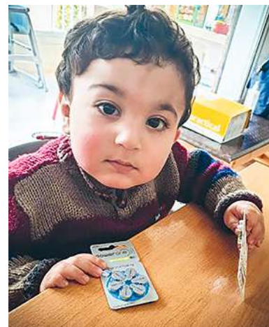
Ein gehörloser Knirps aus der Pre-School (Vorschule) «hilft» ihr dabei.