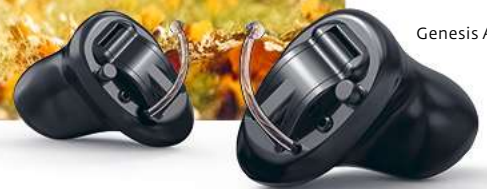
Genesis AI CIC

Sie hören nicht mehr so gut wie früher? Das ist nicht ungewöhnlich. Aber wenn Sie Ihre Mitmenschen nicht mehr richtig verstehen oder Vögel nicht mehr zwitschern hören können, ist Zeit zu handeln. Ein Hörverlust kann uns schöne Momente im Leben verpassen lassen und zu sozialer Isolation beitragen. Wenn Sie eine Veränderung Ihres Hörvermögens bemerken, ist ein Besuch in einem der Kühnis Hörwelt Fachgeschäfte ein sinnvoller erster Schritt. Unsere Akustiker wissen, was zu tun ist, damit Sie wieder besser hören und ein schöneres Leben führen können.