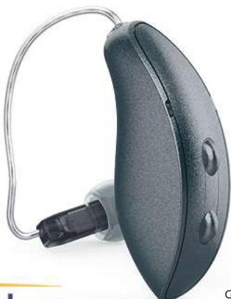
Genesis AI RIC RT

Der Modus optimiert die Klangqualität bei Bedarf auch in herausfordernden Hörumgebungen.